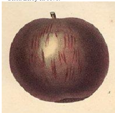
Pomme Noire ».

Selon Jaume Saint Hilaire en 1831(de grosses dimensions). Voir également la fiche « Grosse